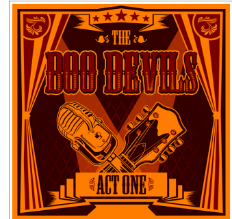
"ACT ONE" (2012)