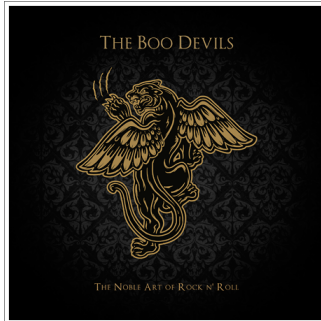
"THE NOBLE ART OF ROCK N' ROLL" (2016)